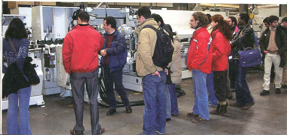
Gli studenti durante una visita presso una grande azienda di produzione di macchine utensili, durante il corso di "Lavorazioni meccaniche del legno".